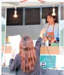
中継コーナー① キッチンカー