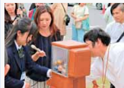
けものチャームガチャガチャ体験

高山村の中学生、渋川女子高校のアナウンス部 吾妻中央高校の生徒さんが中継でレポート！