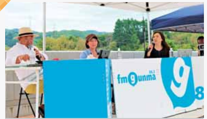
高山村グルメ情報コーナー