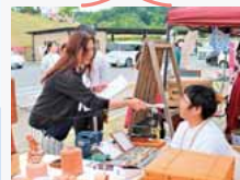
中継コーナー③ ジビエレザ