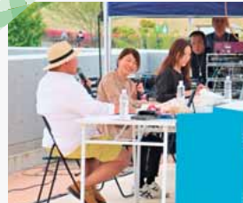
インフォーマーシャル② 地域おこし協力隊 活動紹介