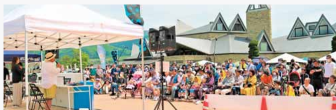
たくさんリスナーさんが集まってくれました