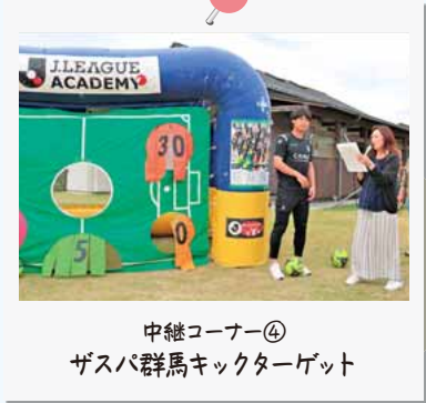
中継コーナー④ ザスパ群馬キックターゲット