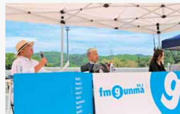
インフォマーシャル① 村長、村の魅力発信タイム！