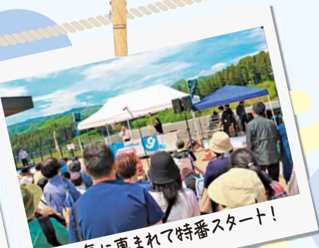
天気にもまれて特番スタート！