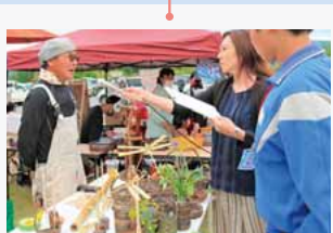
中継コーナー② つるかごあみ