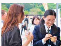
キッチンカーのフードをレポート